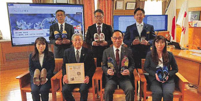
知事室にて南河原商工会中小企業庁長官賞報告