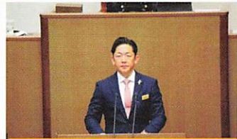
本会議で委員会報告