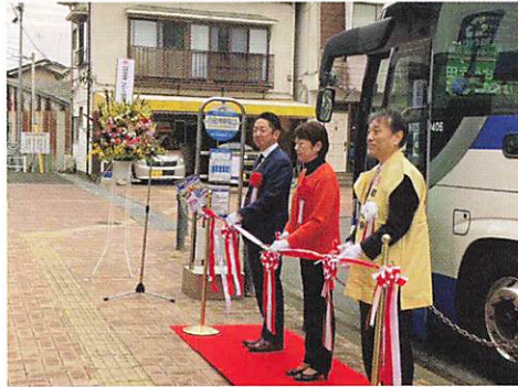
行田市駅にて行田市長と秩父鉄道観光バス「ゆめぐり埼玉号」運行初日セレモニー