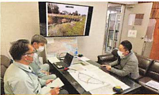
行田県土にて打合せ