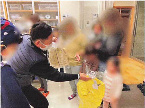
新しい居場所 忍・行田公民館にて毎月第四水曜日開催される「コペル君子ども食堂」のお手伝い