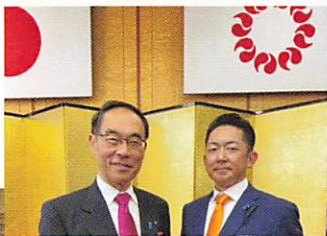
賀詞交歓会で知事と