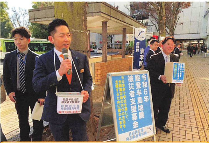
JR浦和駅にて能登半島地震被災者支援募金活動