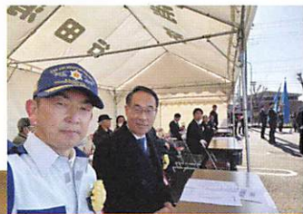
行田市消防出初式